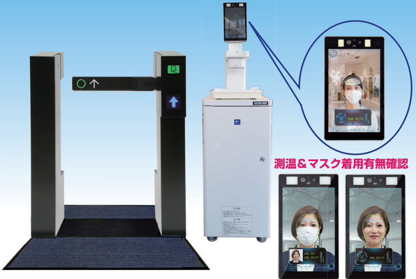
測温&マスク着用有無確認