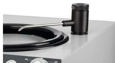
引き出せる給水栓