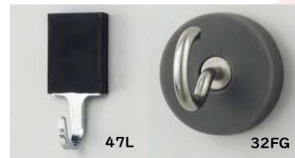
シリコンフックマグネット