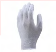
ESDプロテクトパーム